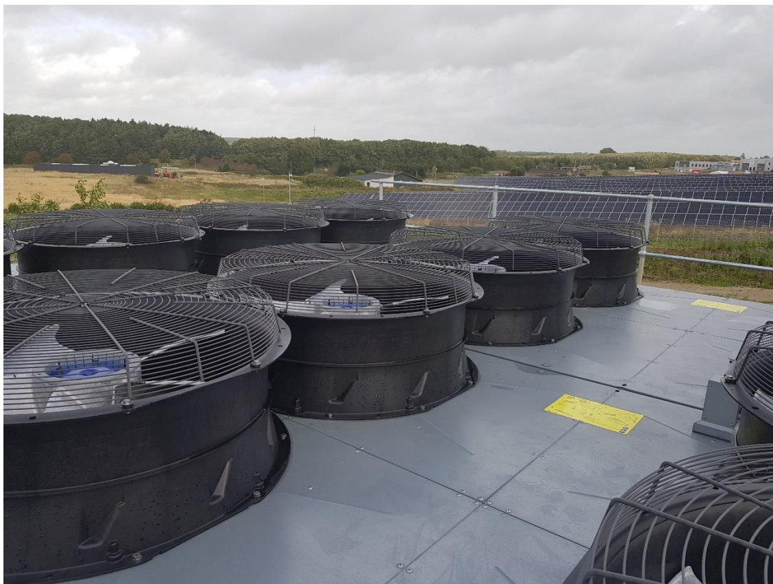
Foto: Assens Fjernvarme: Luchtwarmtepompen en zonnepanelen als lokale bron